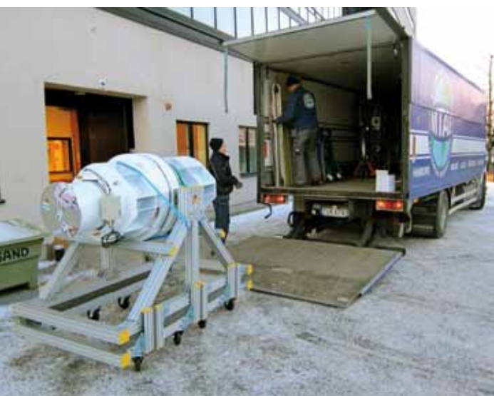
T v: Gammaexperimentet PoGOLite börjar resan från AlbaNova universitetscentrum i Stockholm. Första anhalt blir Linköping för att integreras med attitydkontrollsystemet. Instrumentet är två meter långt och väger 600 kilo.