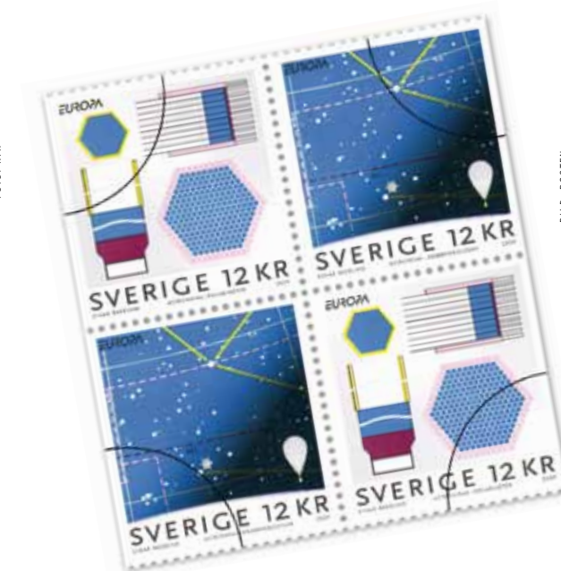
Astronomiärets utrikesfrimärken med bild på PoGOLite och en stjärnkarta som pekar ut ett av dess mål, Krabbnubulosan i Oxen med sin pulsar.

År 2009 hamnade det svenska ballongprojektet PoGOLite på frimärken som gavs ut för att markera Astronomiåret av Posten. Nu blir flygningen äntligen av – och den blir mycket längre och bättre än någon hade väntat sig. Experimentet skulle ha lyft redan sommaren 2010. Efter en olycka i Australien satte NASA stopp för alla forskningsballongflygningar. PoGOLite blev försenad med ett år, men får en unik möjlighet, att bli den första större ballongen som med start på Esrange gör ett helt varv runt Arktis under hela 24 dagar.