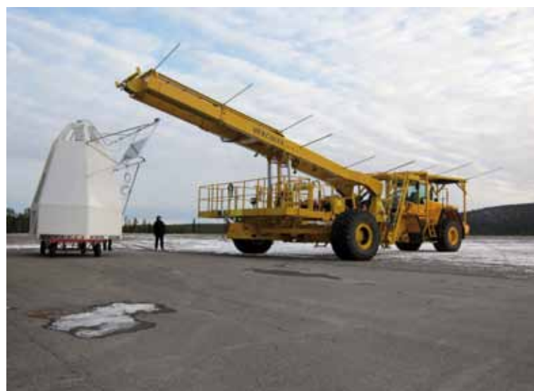
Gondolen som ska bära PoGOLite på dess arktiska färd i sommar, är utvecklad av Rymdbolaget på Esrange. Till höger står ballonglastbilen. Ballongens last inklusive gondol blir totalt 2 ton.